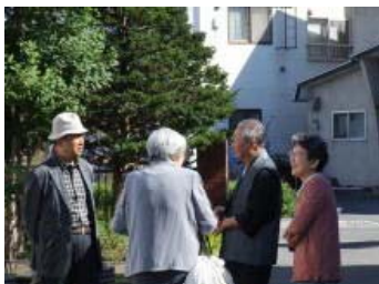
9:30、相川病院で待ち合わせ