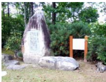
三浦綾子の文学碑も