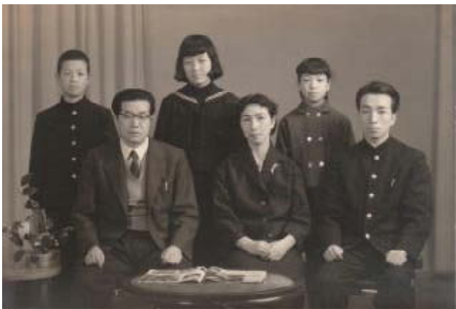
家族そろって。1958(昭33)年撮影。

るのは、父が柱か茶ダンスに、ブツとさして、子供たちをふるえあがらせる。それが、2〜3m先から、いい具合に飛んでささる。子供たちがなかなかなない夜などに、おこる。となりの、がたいの大きな、馬車追いのおじさんがきていた時も、それがおこり、その後、家に遊びにこられなくなる。そして、よく“あの時、先生こわかったよナ”と。家には、教え子のお兄さん(子供の私がらみ)、父の文学仲間、国籍の多いという卒業生、親セキの人等、お客さんの多い家なのに、その人たちがいない時に、そういうことがおこることが多い。又、突然おこりだすと、子供たちは、すごいいきおいで逃げだす。兄は、裸足で外へ、他は、皆おた々して、かくれる、と玄関へでて“逃げ足の速い奴だ”と、深追いはせずそれで終る。そういうことは、古い家の時で玄関前に小説懇話会の札が、かかっていた頃のことである。