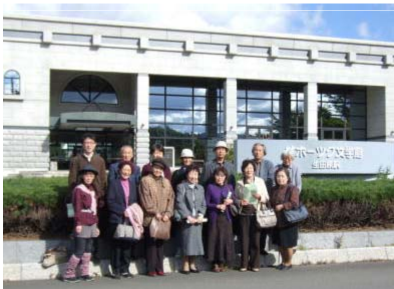
オホーツク文学館を背景に