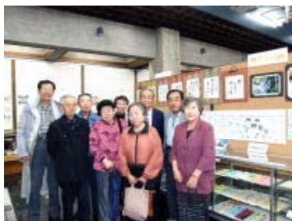
120年展川柳コーナーでの飾り付けを終えて。作品を前に記念スナップの会員有志