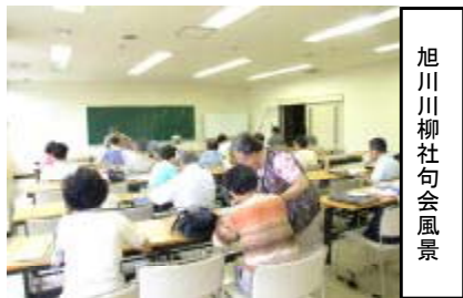
旭川川柳社句会風景

9年間の資料収集・整理、今回の「旭川・文学の120年展」の開催、本当にご苦勞様でした。旭川文学資料友の会のますますのご発展を祈念いたします。