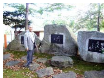
苔むす文学碑公園。いろんな形の碑が静かに佇んでいます。