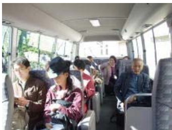
バスに乗り込み出発！