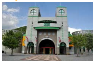
無理のないスケジュールで印象深い小旅行。秋の思い出、創作の刺激にもなりました。