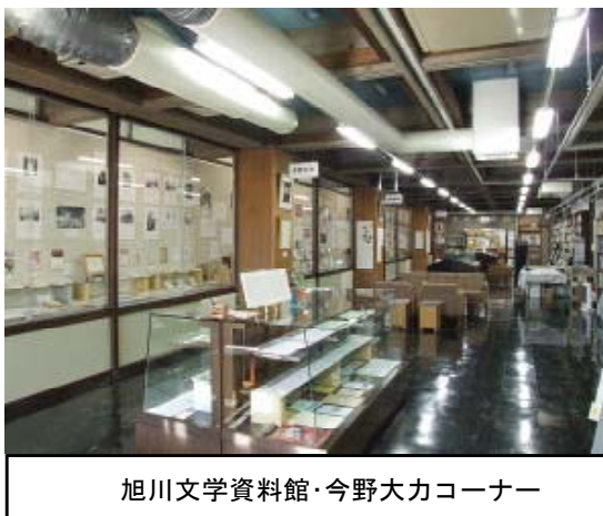
旭川文学資料館・今野大力コーナー